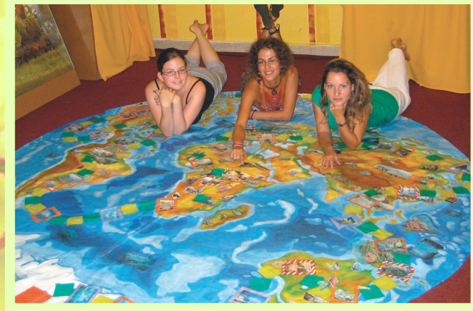
„Mentsük meg a Föld Anyát!”

Dísz- és haszonnövények, házi- és haszonállatok megismerése (játékok, állathang felismerés, alkotás)