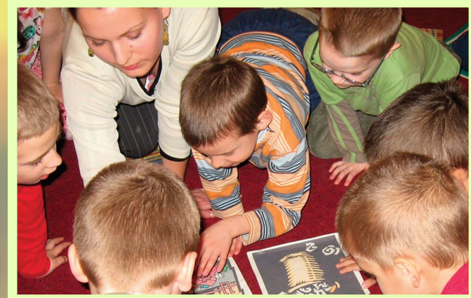
„Mi fán terem a papír?”